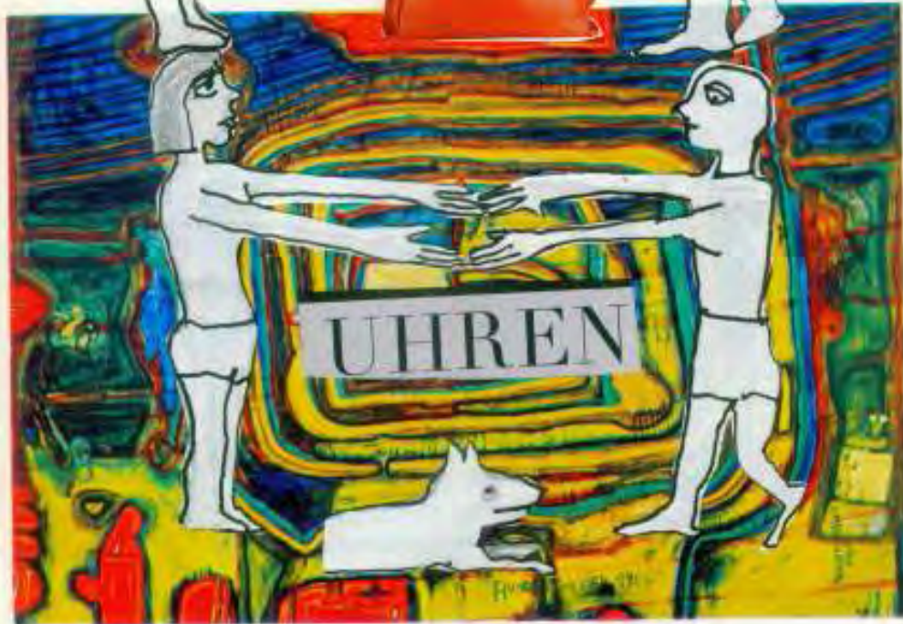
14 Hundertwasser, 1960