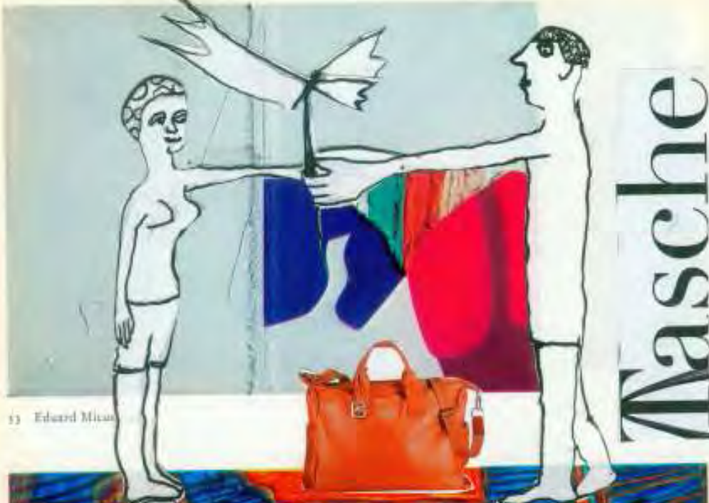
13 Edvard Munch

F Nur kurze Zeit: Freundschaftswerbung bringt Glück