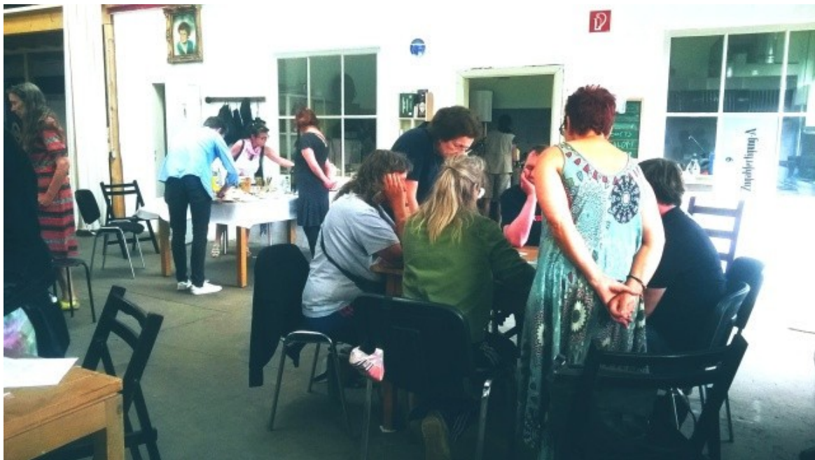
Spieler_innen und Zaungäste - Gehörtes und Gesehenes wird memoriert.

Memory is our ability to encode, store, retain and subsequently recall information and past experiences in the human brain over time for the purpose of influencing future action.