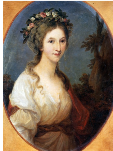
Anna Dorothea von Kurland 1781-1821

Ich war sehr viel unterwegs zwischen St.Petersburg und Paris, per Kutsche von Warschau, nach Karlsbad, Berlin und Wien ...