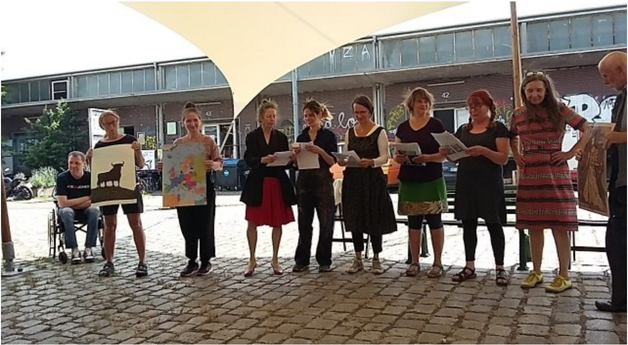
Die Performerinnen zu sechst in der Bildmitte - Intro zu Fakten und Daten Rechts und links außen: Gäste mit Anschauungsmaterial