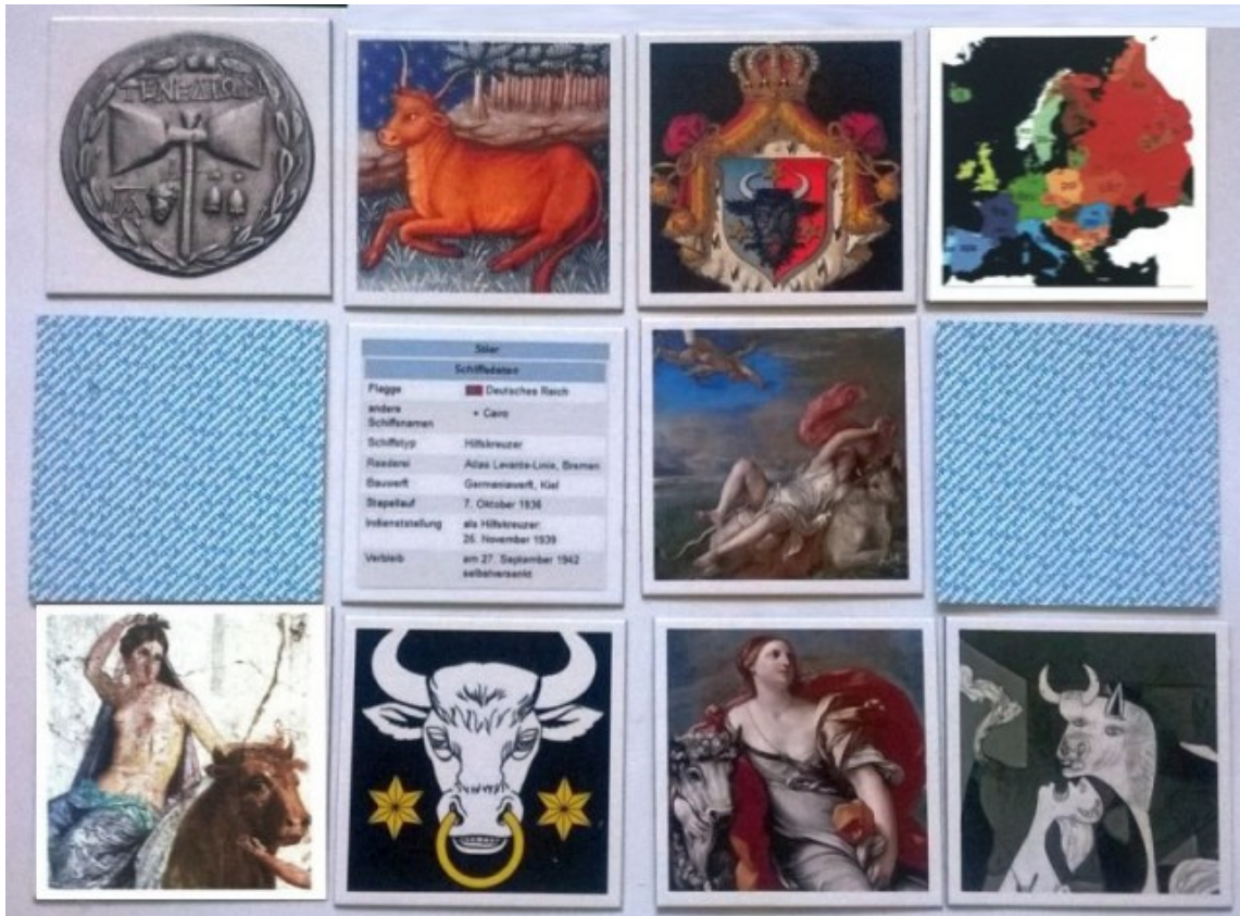
Das aus umfangreichem Bildmaterial gestaltete Memory-Unikat ist 36tlg.